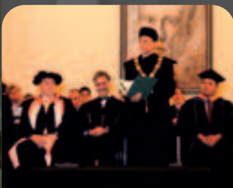
Märkte: International Mining School » Seite 13