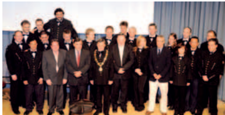
Die Absolventen des Universitätslehrgangs „International Mining“ 2007 - 2009 beim abschließenden Ledersprung mit ihren Professoren und dem Rektor der Montanuniversität