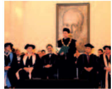
Internationale Akademische Feier

Aufgrund des großen Erfolges soll die International Mining School zukünftig geographisch und thematisch weiter ausgebaut werden. Partnerschaften mit der Bergakademie St. Petersburg sowie mit Universitäten in Asien und Südamerika werden angestrebt.