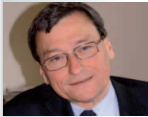
Rektor Wolfhard Wegscheider

Die BIG hat mit den 21 öffentlichen Universitäten alle Hände voll zu tun. Denn insgesamt umfasst das Universitätsportfolio in Österreich rund 385 Objekte mit einer Fläche von rund 1,6 Millionen Quadratmetern. Und seit einigen Jahren wird massiv in die Infrastruktur der 21 öffentlichen Universitäten Österreichs investiert. Projekte müssen aufgrund des durchaus vorhandenen Optimierungspotenzials nicht neu erfunden, sondern „nur“ die Finanzierung sichergestellt und auf Schiene gebracht werden. Fakt ist: Der Terminus „Offensive“ ist durchaus gerechtfertigt. So wurde auch das