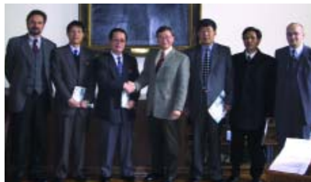
Eine Delegation aus Nordkorea zu Besuch an der Montanuni

der Mine. „Wir haben die Bergleute vor Ort auf die neu installierten Abbaumaschinen eingeschult und sie mit der notwendigen Abbau- und Förderlogistik vertraut gemacht“, so Kessler weiter. Die ausgezeichneten Sanierungsergebnisse der Chikdong Youth Coal Mine sollen als Grundlage für weitere Kohleminen in Nordkorea herangezogen werden. „Die Erhöhung der Kohle-