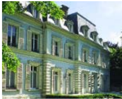
Die Ecole des Mines de Paris ist seit zehn Jahren Kooperationspartner der Leobener Bergbaukunde.