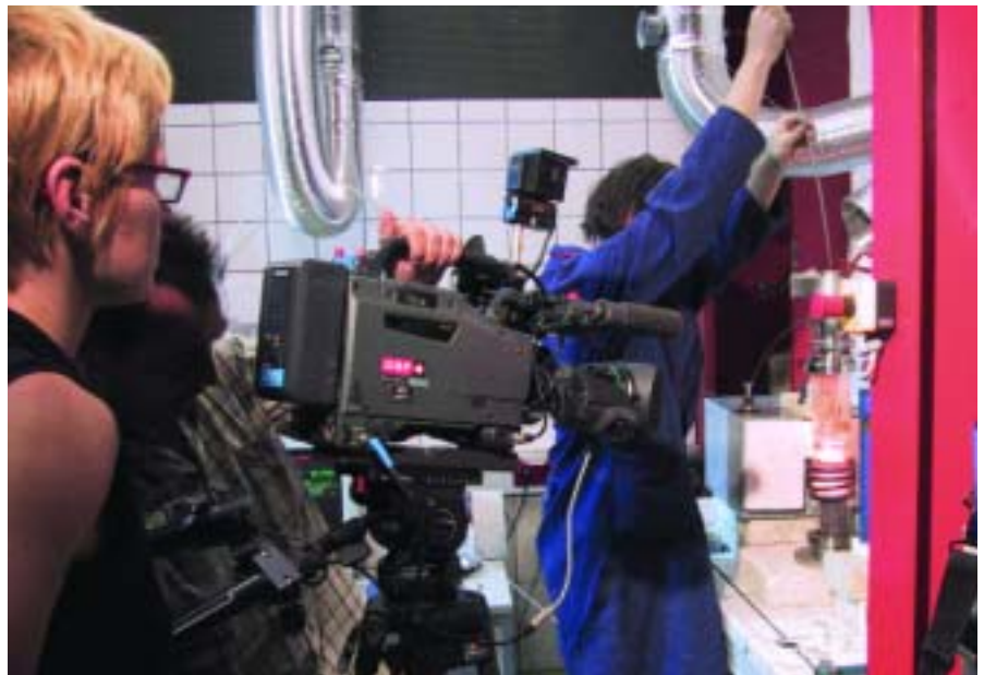
Der ORF filmte im Labor des Institutes, um für die Sendung „Modern Times“ einen Beitrag über die Produktion von Alternativbrennstoff aus Müll zu gestalten.

Das Institut für Nachhaltige Abfallwirtschaft und Entsorgungstechnik beschäftigte sich in diesem Projekt mit der Aufbereitung und der Qualitätssicherung und steuerte den technischen Support bei. In einer Splittinganlage bei Saubermacher wird der Müll mechanisch sortiert, in Retznei auf die