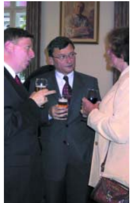
Das Absolvententreffen bot den geeigneten Rahmen, um über das neue Universitäts-gesetz und das 100-Jahr- Jubiläum des Dr.mont. zu diskutieren.