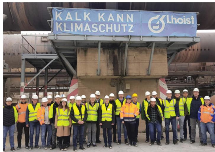
Exkursion des 9. IHM-Jahrgangs