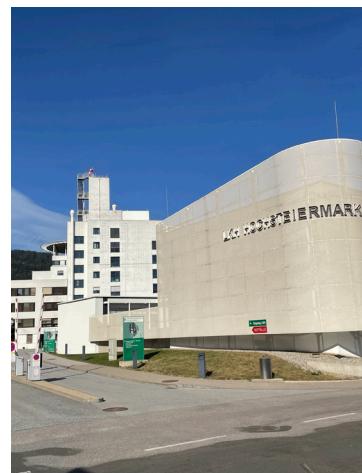
Das LKH Hochsteiermark in Leoben: das chirurgische Zentrum. Kern

Das LKH Hochsteiermark rief ein innovatives Kooperationsmodell ins Leben: die Partnerschaft zwischen Pädiatrie und Anästhesie. Durch die gezielte Rotation junger, engagierter Assistenzärzte zwischen der Abteilung für Kinder- und Jugendheilkunde und der Abteilung für Anästhesie und Intensivmedizin am Standort Leoben profitieren beide Bereiche.