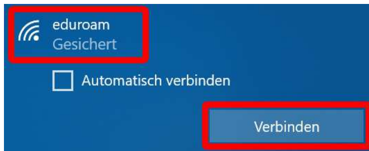
Abbildung 1: Das Netzwerk eduroam

Klicken Sie auf das WLAN-Symbol in der Taskleiste am rechten unteren Bildschirmrand, wählen das Netzwerk „ eduroam “ aus und klicken auf „ Verbinden “ (Abbildung 1).