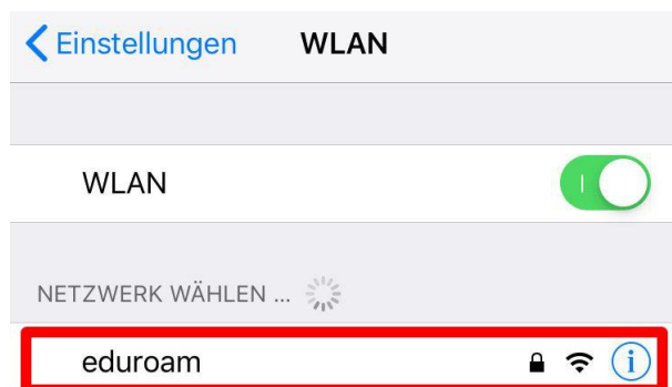
Abbildung 1: Das Netzwerk eduroam

Öffnen Sie Ihre WLAN Einstellungen und wählen das Netzwerk „ eduroam “ aus (Abbildung 1).