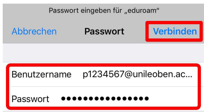
Abbildung 2: Eingabe Benutzername und Passwort iOS

Geben Sie Ihre Zugangsdaten ( MUonline Benutzername ) + „ @unileoben.ac.at “ sowie das zugehörige Passwort ein und bestätigen mit „ Verbinden “ (Abbildung 2).